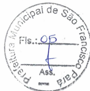
Anselmo Lobo de Lira Secretário Municipal de Infraestrutura